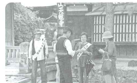
街頭募金活動の様子

皆様からの貴重なご厚意は主に右記の活動に使われます。今後とも共同募金へのご理解・ご協力をよろしくお願い致します。