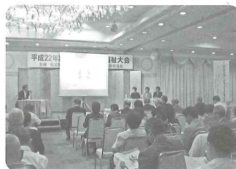
第22回右京区福祉のまちづくり学校