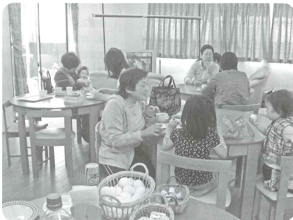
幅広い世代交流で住民の絆を! / 西京極学区大門ハイツ・手作り喫茶店

URL ; http://www.ukyoku-syakyu.net / E-mail ; info@ukyoku-syakyu.net