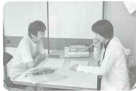
ふれあいホットライン(交代制)

に活動できています。」と語られました。また、高齢者だけでなく、子育て世代の「ヤングママの会」というサロンの定期的な開催、自治会の取組で福祉と防災を意識した「さくら支えあいマップ」(次頁)を全戸配布されるなど、「地域でできることはみんなでやろうよ」という意識の高さを感じる報告でした。