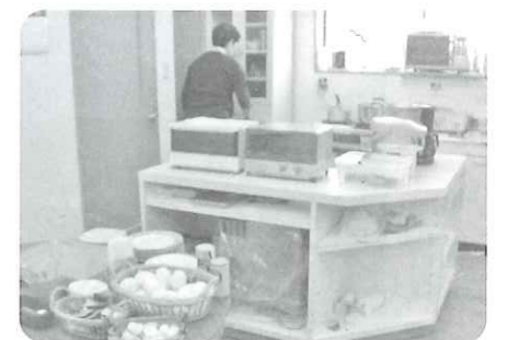
明るい日差しを集会所キッチン

人暮らしの高齢者も多いとのこと。この集会所はマンションだけでなく、学区の福祉活動の拠点の一つとしても活用されており、マンションが増加傾向にある右京区の福祉活動の好例になるのではないのでしょうか。