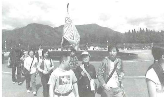
恐竜博物館、どきどきワクワク。

こまごまのこつぎんてい バスの けんすうが少なくて困っています。 友達関係で悩んでいます。 まっちゃかいのまっちゃがのめない。 むかしよりはやくおんじょうができて たれてきました。かんばっています。