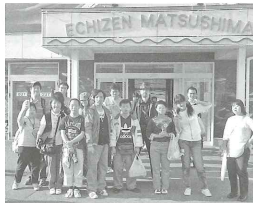
1泊旅行で越前方面に行きました。

入浴日除夜の三舌重カでとち全園エセに行き 旅行や休日余暇支援などがまた行きたい です。 会社や他の施設の見学をしたい。 買い物をしてメリハリをしたい クルーズ外出をしたい