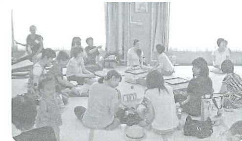
地域の子育て支援にも貢献!(安井学区)