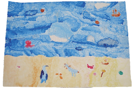
3年 松尾 遥都 『クジラ先生のしおふき』