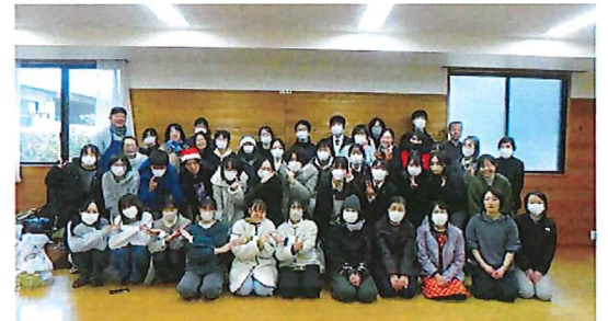
スタッフ・ボランティアの皆さん

オープンは11時ですが、10時20分にはすでに多くの方が並んでいて整理券を配布。今日のメニューがちらし寿司であることとクリスマス前で絵本の配布などあることが人気のようです。台所とお弁当盛り付けの部屋は大忙し、息もつかないほどで、学生さんは野菜の仕分け・袋詰めなどベテランの主婦の指示でキビキビ、テキパキ。時間になり来られた親子連れ、お年寄りの方々は、手に持ちきれないほどの食品とお手伝いの方々の温かい気持ちに満面の笑顔で家路につかれました。