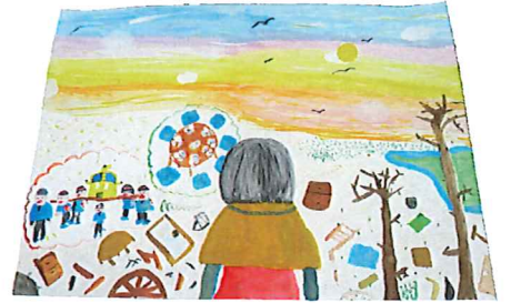
5年 明石 一知葉 『夕焼けにうつる思い出』