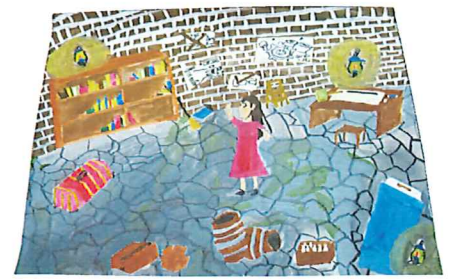
6年 奥山 賢宇 『マッティの秘密基地』